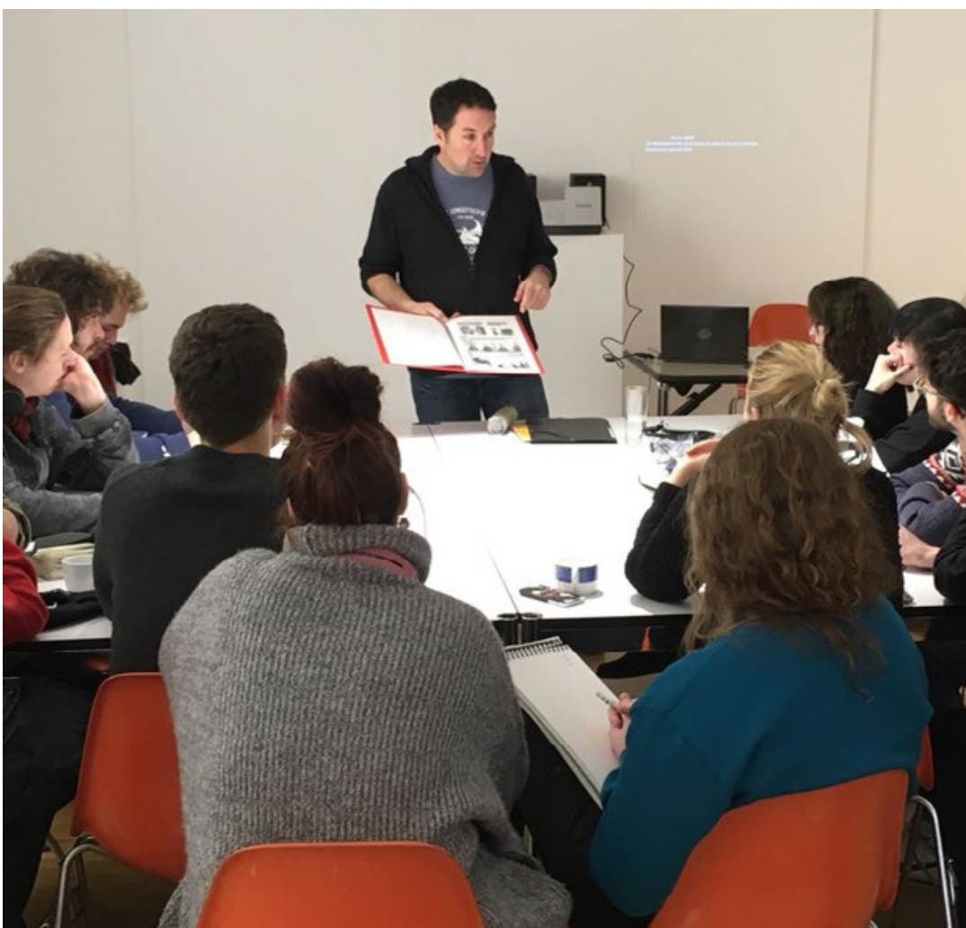
Guy Delisle est venu partager son savoir dans le cadre de cette nouvelle formation.

Ainsi, une semaine de cours comporte un jour et demi d'atelier bande dessinée, une