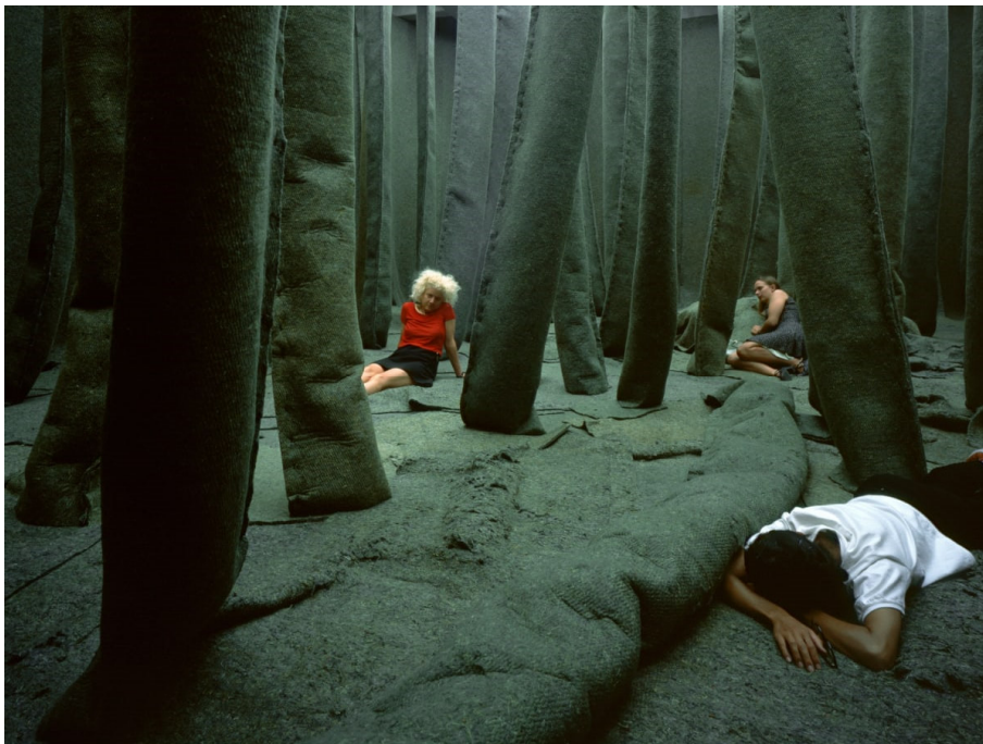
Xavier Veilhan, La Forêt , 1998 Collection MAMCO, Genève, Suisse.