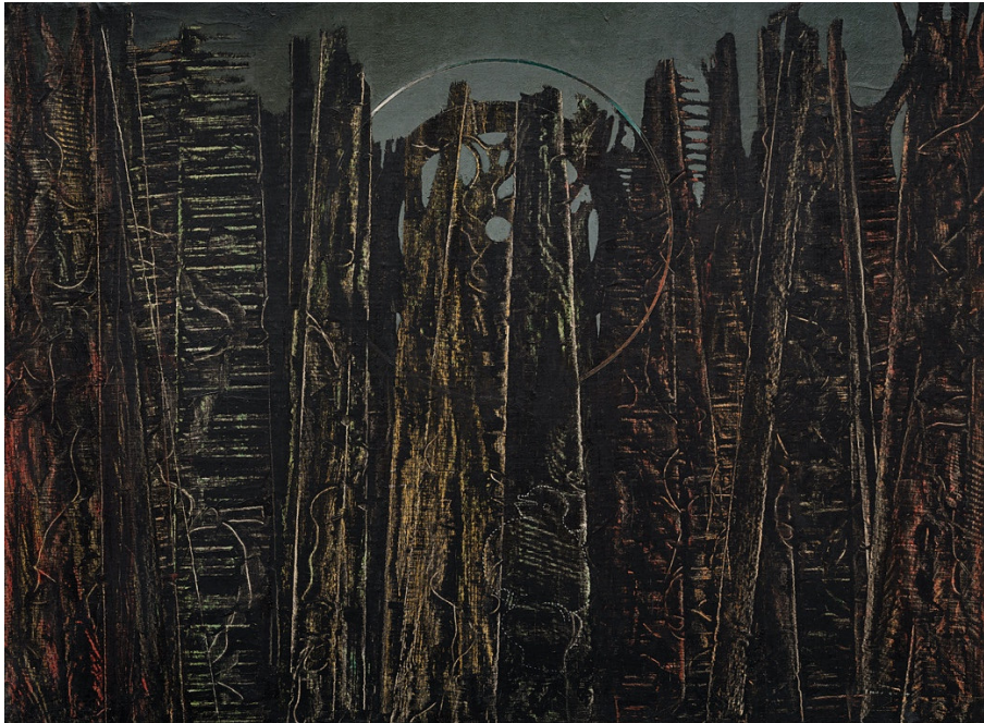
Max Ernst, La Forêt, 1927-1928