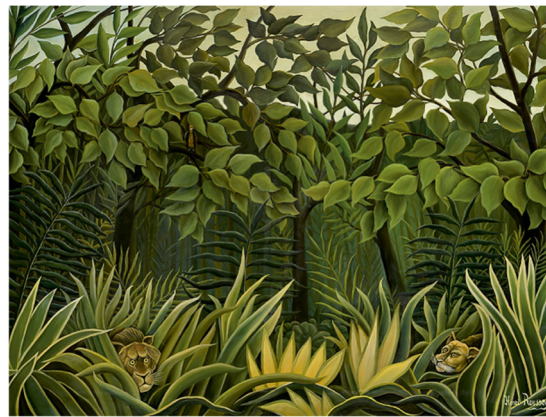
Henri Rousseau, Deux lions à l'affût dans la jungle , 1909, huile s/toile; 84,5 cm x 119,8, collection privée