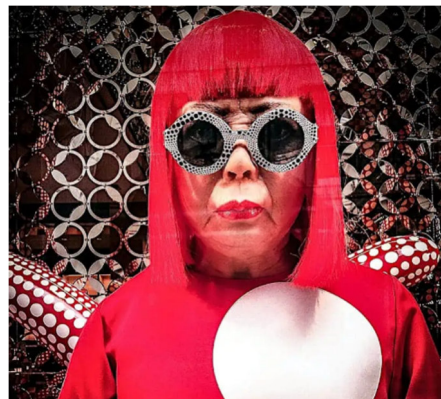
Modèle en cire de Yayoi Kusama chez Louis Vuitton pour le dévoilement de la collection 2012