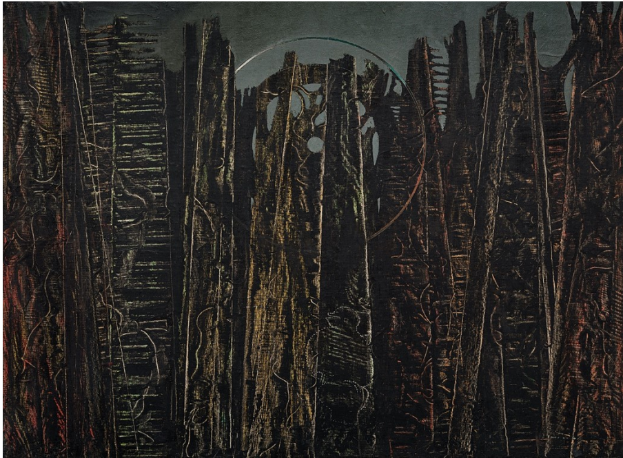
Max Ernst, La Forêt, 1927-1928